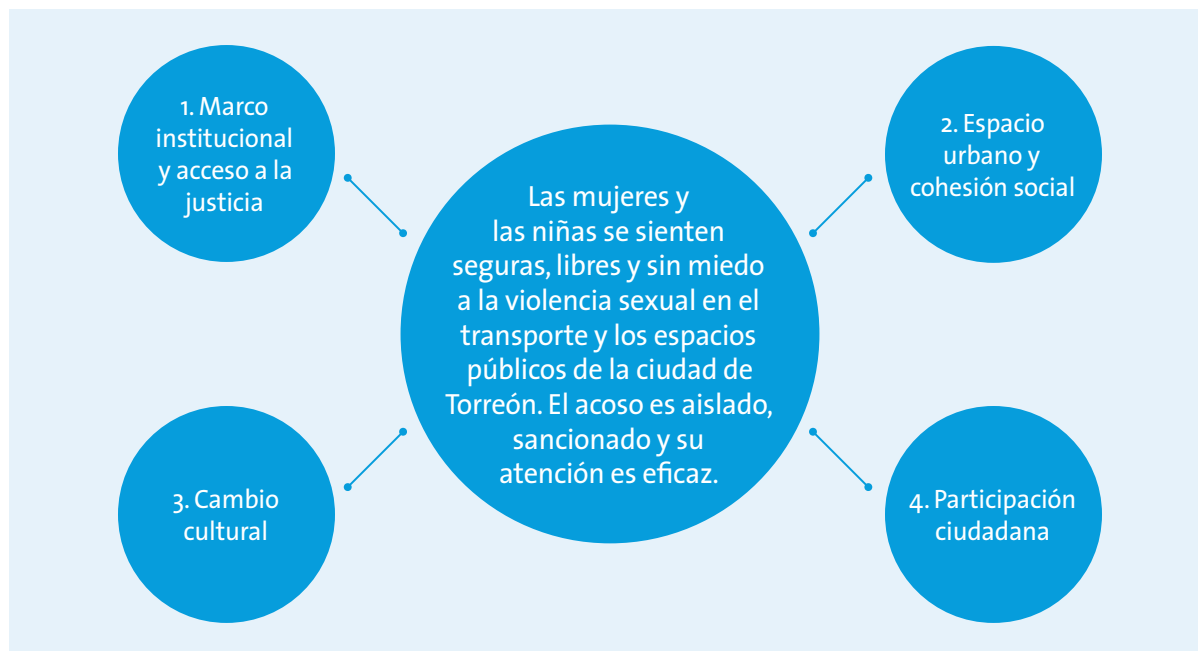
FIGURA 1. Áreas de cambio