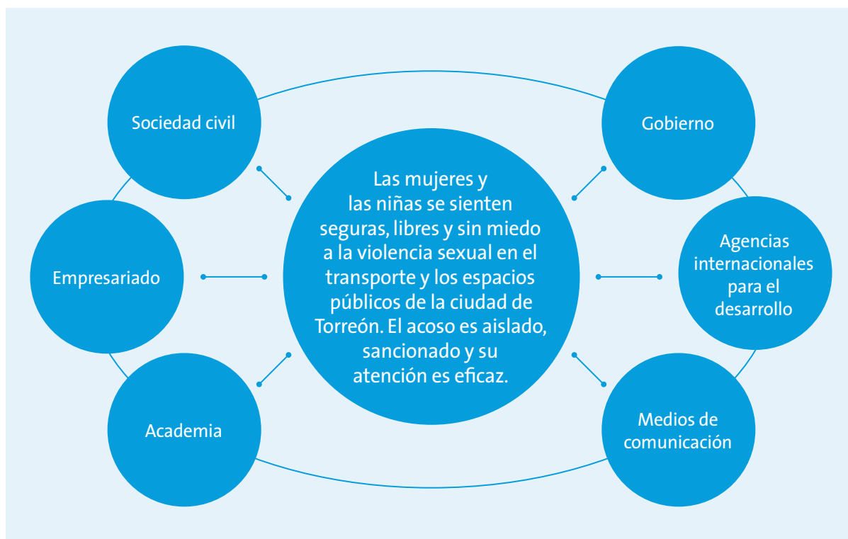
FIGURA 2. Alianzas

El principal actor institucional encargado de impulsar los cambios propuestos en el Programa es el Instituto Municipal de la Mujeres, debido a su experiencia, sus atribuciones y su capacidad de acción en la materia. En otras palabras, de acuerdo con lo establecido en la ley y por su rol normativo y articulador en el despliegue de las políticas públicas del gobierno local, el Instituto es un actor clave para ahondar en el conocimiento y la visibilización del problema, así como para la promoción, gestión e implementación de acciones para su atención.